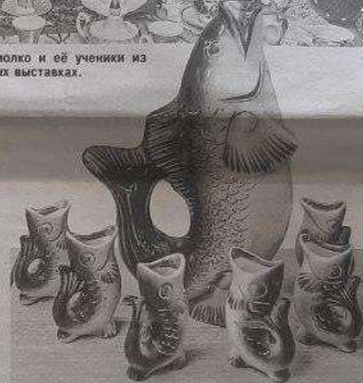
Шик советского времени — наборы рыбок для напитков покрепче чая.

Рассказывая об отличиях фарфора от фаянса, заведующая музеем отмечает, что большая часть из современных сервизов фаянсовые. Фарфор — материал гораздо более трудоемкий и дорогостоящий, к тому же достаточно хрупкий. В изысканности он превосходит фаянс. Существует много разновидностей фарфора. Есть даже бисвитный — неглазурованный с матовой поверхностью. Во время экскурсии дети узнают много интересных фактов. Например, в старину для усатых мужчин выпускали специальные чашки с «полочкой» для усов, чтобы они не намочили в жидкости.