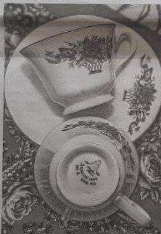
Чайные пары с надписью «Японское море» — настоящий раритет. Их выпускали в Японии для экспорта в СССР.

Смотрите, на обратной стороне чашки нарисован вулкан и есть надпись «Японское море». Бабушка купила эту пару у внука, которого давным-давно наградили таким подарком за труд.