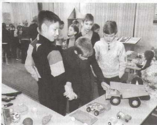
Приобщаемся к познанию