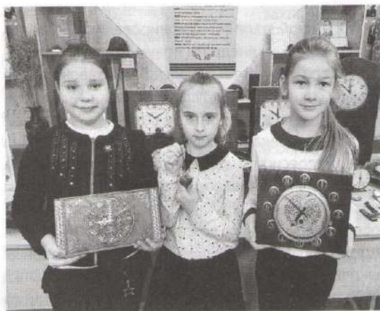
Музейные предметы в наших руках

На выставке было представлено более 700 самых разнообразных календарей по разным темам, где особое внимание уделено национальным, государственным праздникам, памятным датам. На многих календарях изображены белорусские пейзажи, демонстрирующие красоту природы нашей страны, а также памятники архитектуры и народного зодчества, являющие многообразие архитектурных форм и композиций. Многие календари-экспонаты,